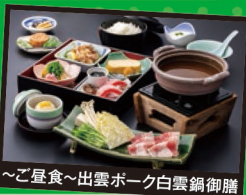
~ご昼食~出雲ポーク白雲鍋御膳